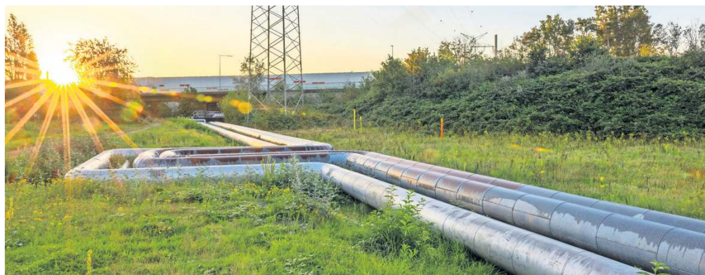
Ob sich Fernwärme für das eigene Haus lohnt, kann ein unabhängiger Energieberater berechnen.