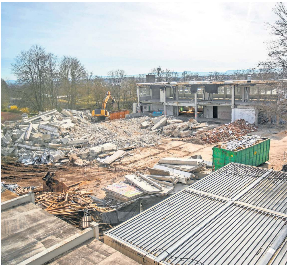
Das PCB-verseuchte Schulhaus wurde dem Erdboden gleichgemacht. Mit dem Ferienende sind die letzten Mauern gefallen.