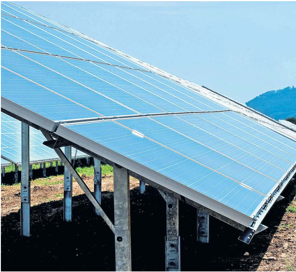
Bei der Umstellung von fossilen Energieträgern auf Erneuerbare Energien spielt neben der Windkraft die Photovoltaik eine zentrale Rolle – auch in der Region Stuttgart. Hier eine PV-Anlage in Wäschenbeuren (Kreis Göppingen).