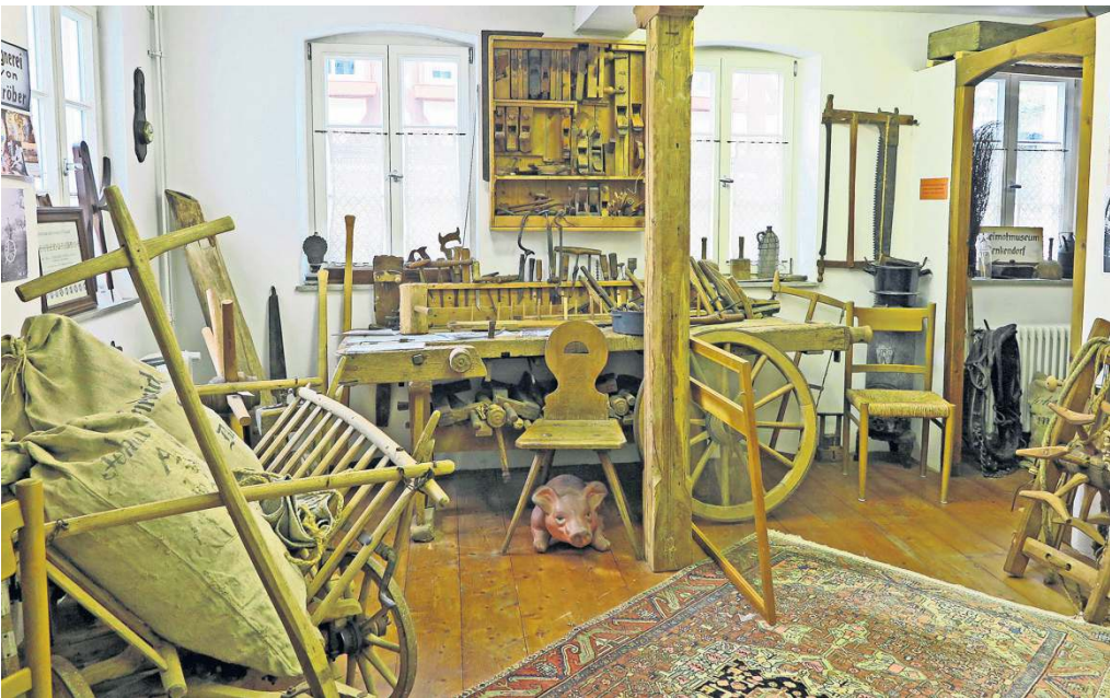
Die ehemalige Wagnerei von J. Gröber hat im Museum Platz bekommen.

Dem Team, das in die Neugestaltung rund 2000 ehrenamtliche Arbeitsstunden gesteckt hat, wird die Arbeit auch künftig nicht ausgehen. Als nächsten Schritt wollen die Ehrenamtlichen den Museumsraum im „Alten Bären“ neu gestalten. Und sie wollen das Museum nach außen präsentieren: durch Filme oder Fotoschauen etwa. Zudem soll jährlich eine Ausstellung im Rathaus gezeigt werden. Denn das Museum ist als historisches Gebäude nicht barrierefrei. Auch stehe die Digitalisierung des Bestandes an, betont Haring.