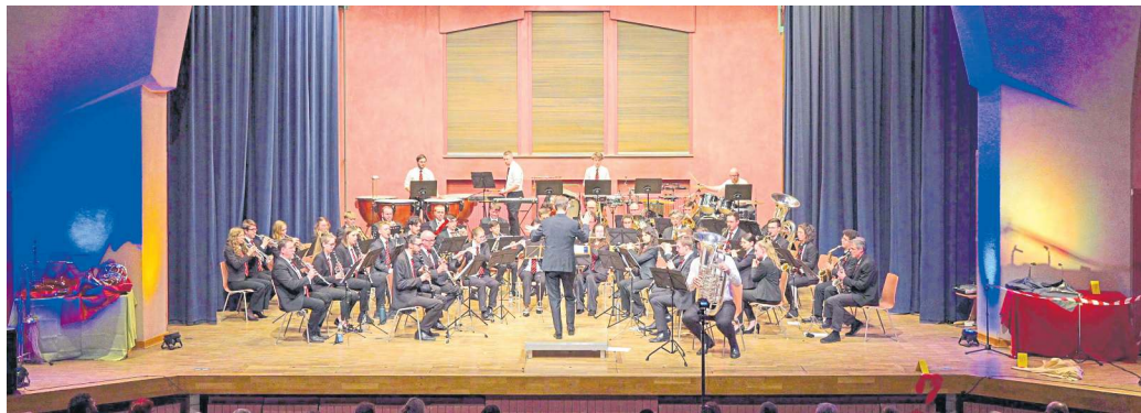
Auf große Begeisterung stieß das Concerto Primo der Stadtkapelle Nürtingen in der Rudolf Steiner Schule.

Dieses Jahr ist bekannterweise die Tuba als das Instrument des Jahres gewählt worden. In der Kriminalgeschichte, die sich die Stadtkapelle für das Konzert ausgedacht hat, ruft das natürlich Unmut unter den anderen Instrumenten hervor. So bildete sich eine Verschörung in der Musikerunterwelt. Die Turmbläser, gefolgt vom Vororchester, eröffnen das Konzert. Anfangs geht es der Tuba noch gut, jedoch spüren die Zuschauer, dass sie immer mehr in Gefahr gerät. Damit die Tuba sicher ist, wurden unterschiedliche Ermittler eingesetzt. So wurde durch eine lustige und treffende musikalische