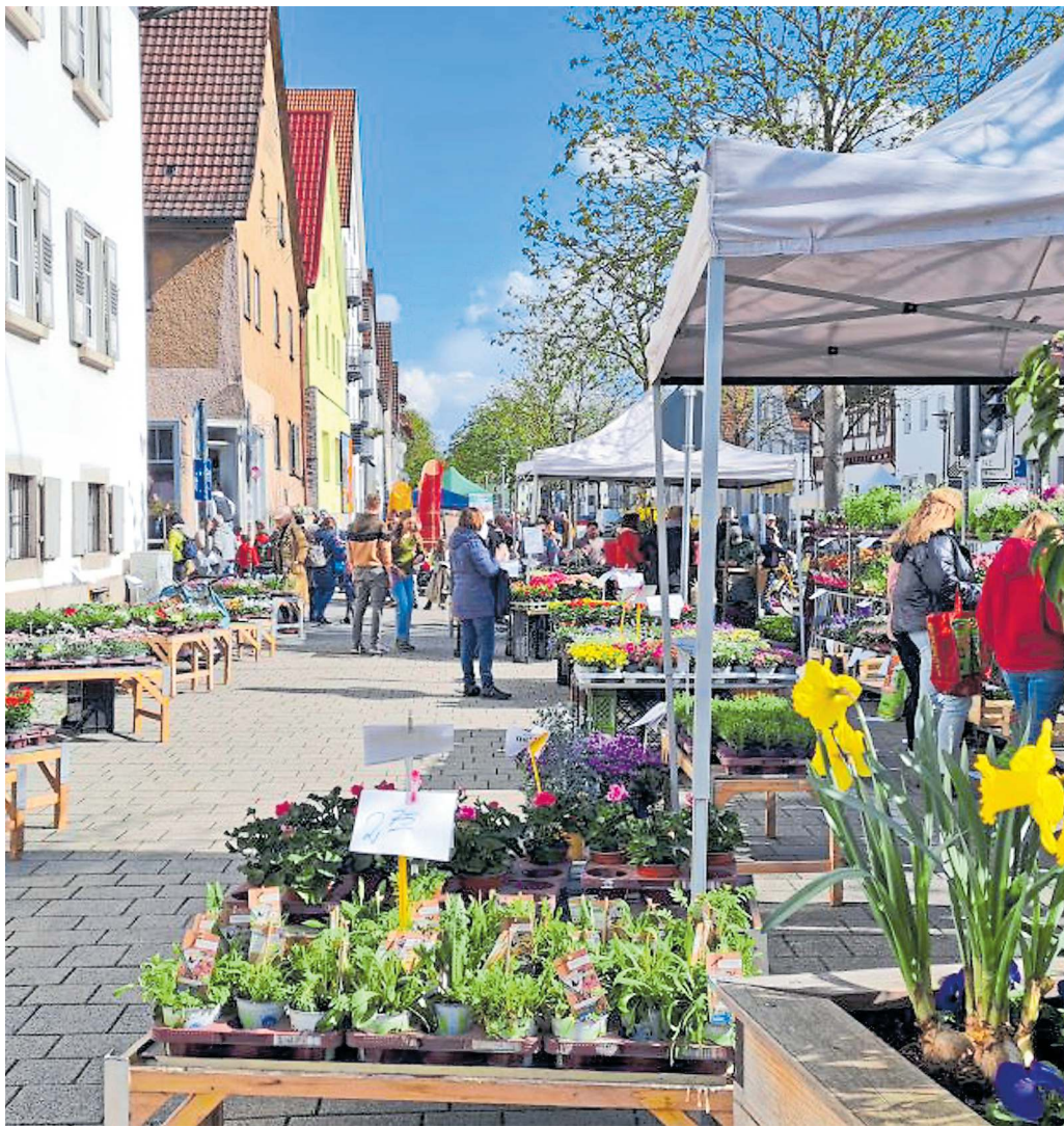
Der Fensterblümllesmarkt macht Lust, sich mit farnefrohen Pflanzen einzudecken.

Info: Weitere Informationen gibt es im Internet unter: www.k3n.de/fbm und www.nuertingen.de/fruehling-herbst