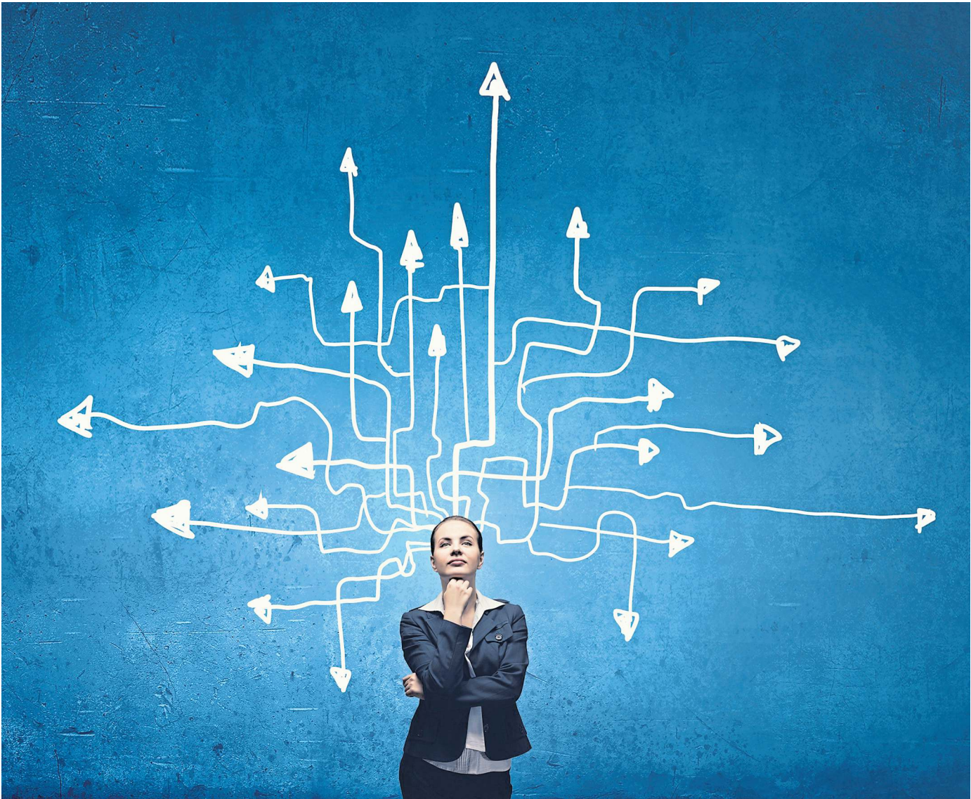
Wohin führt die Arbeitswelt von morgen? Die Digitalisierung spielt dabei eine große Rolle.

Instant-Messenger, Videotelefonie, Sprachnachrichten – im privaten Bereich sind diese Kommunikationstechnologien längst selbstverständlich geworden. Doch in weiten Teilen der Arbeitswelt waren sie bis vor einiger Zeit noch eher selten anzutreffen. Größere Besprechungen wurden von Angesicht zu Angesicht in Konferenzräumen abgehalten, Geschäftsreisen gingen um die ganze Welt und Teamarbeit fand nicht selten im gemeinsamen Büro statt. Das hat sich in zahlreichen Branchen inzwischen grundlegend geändert – und wird auch weiterhin Trend bleiben. Unternehmen werden verstärkt auf eine digitale Kommunikation und Zusammenarbeit setzen. Dabei zum Einsatz kommen zum Beispiel die folgenden Kollaborationstools: Kommunikationssoftware für Textnachrichten, Sprachchats und Videokonferenzen, Software für das Projektmanagement zur Koordination und Verteilung von Aufgaben, Software zum gemeinsamen Bearbeiten von Dokumenten, Dienste zur Speicherung und den Transfer von Daten sowie Intranets.