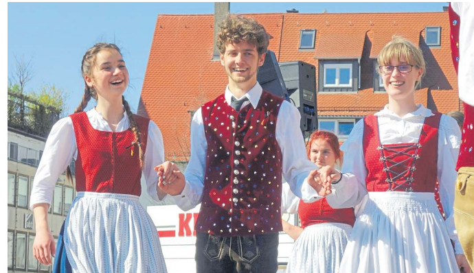
Volkstanzgruppe Neckarhausen in der Neckartäler Tracht

Info: Die Veranstaltung findet an den folgenden Sonntagen statt: 14. April, 21. April und 28. April. Weitere Infos unter www.neckarhausen.albverein.eu. Um Anmeldung unter stefan.traeuble@albverein-kulturatt.de wird gebeten.