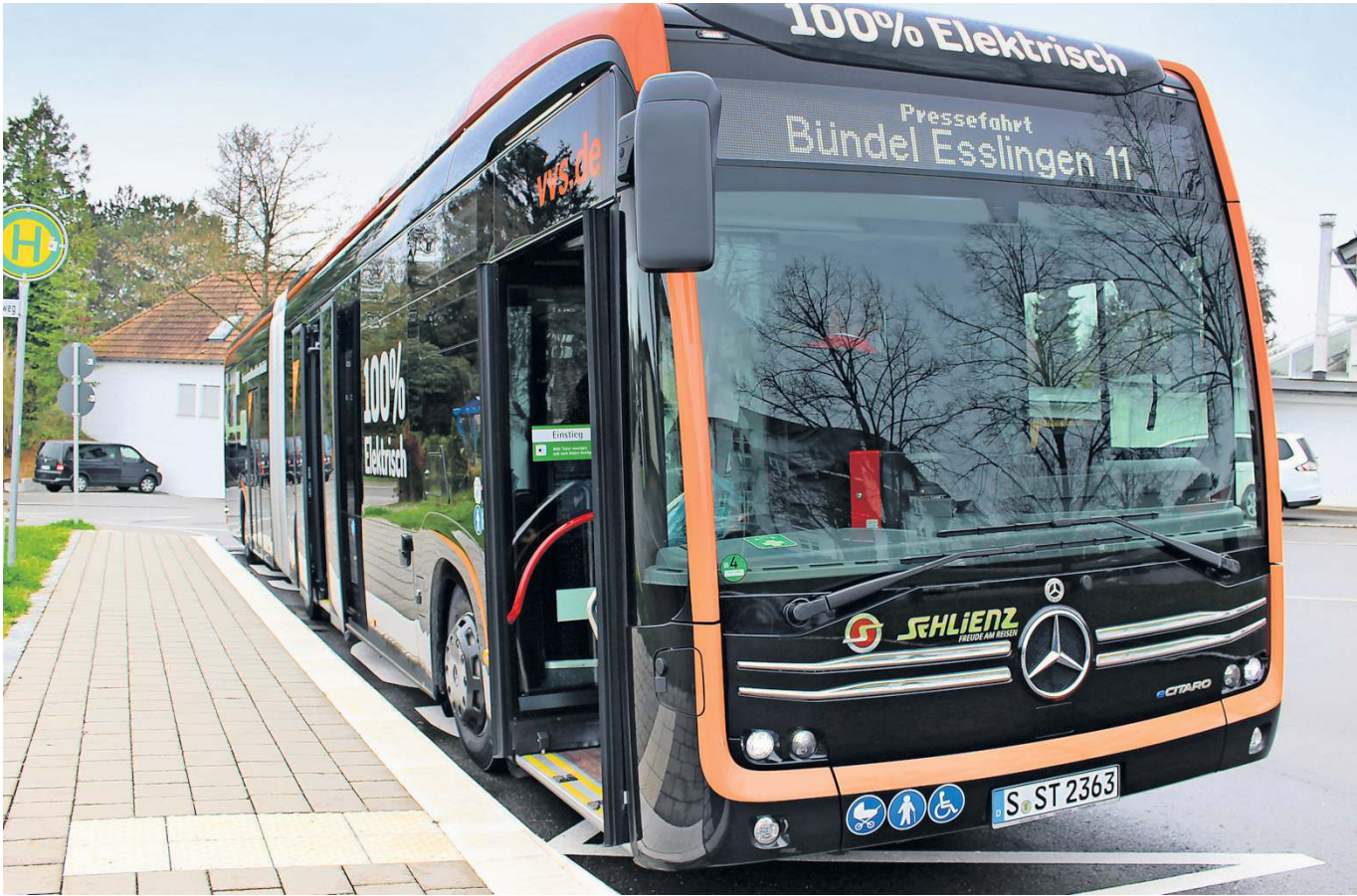
Im sogenannten Linienbündel 11 gibt es einige Veränderungen. Neben Fahrplanverbesserungen werden auf einigen Linien auch modernere Fahrzeuge eingesetzt.